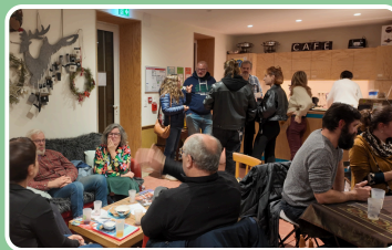
Soirée vin chaud