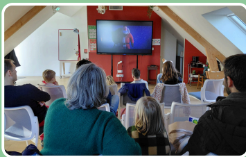
Film de Noël