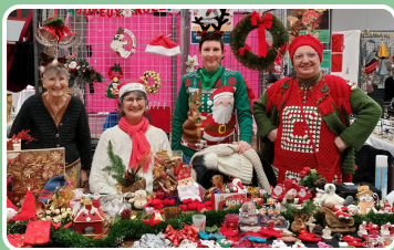
Marché de Noël