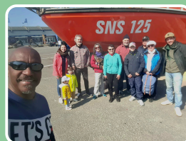
Pêche à pied à la mer avec les bénévoles