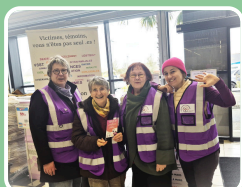
Collecte contre la précarité menstruelle Voice44