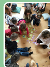
Journée Mama Quilla : les âges du féminin