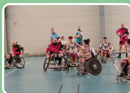
En course vers l'égalité, journée du 8 mars "Sport au féminin"