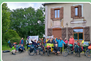
Roule Ma Poule, LalaTour