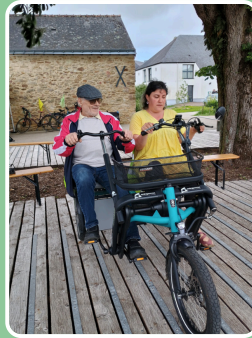
Roule Ma Poule, vélos adaptés