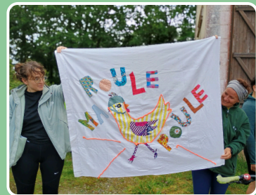
Roule Ma Poule, bannière LalaaTour