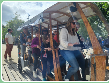
Roule Ma Poule, Woodybus